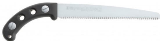
Figura 3: esempio di seghetto da utilizzare

In data 30.07.2025 è stato notato il taglio netto delle radici di diametro inferiore a 4 cm ma non di quelle di 8-10 cm. Il sottoscritto ha fornito indicazioni alla ditta in merito alle modalità di taglio netto da effettuarsi con seghetto manuale al fine di ridurre la superficie lesionata.